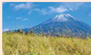
協会が初めて取得した富士山高原トラスト

自然を守り再生するために何か遺したい、相続した財産を寄付したいがどうすれば良いか？