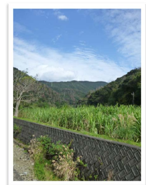
古志集落側から望むトラスト地の森(奥)

林道周辺は、アマミノクロウサギなど野生生物のすみかです。動物が飛び出す可能性があるため、ご注意ください。