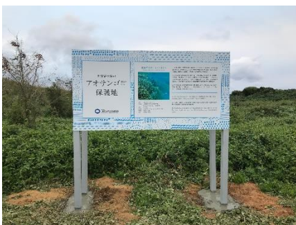
トラスト地に設置した看板

この度の看板設置と白保の海の保全をめぐる状況について、貴媒体でご紹介いただけますようお願い申し上げます。