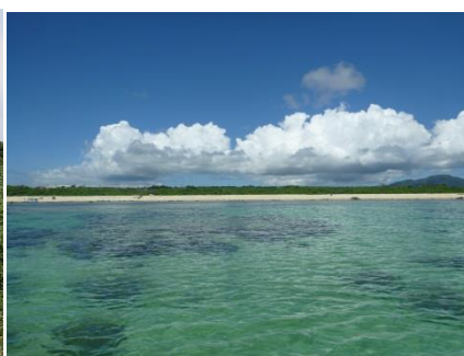
アオサンゴの海から トラスト地周辺を望む