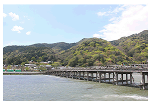
京都・嵐山の森 トラスト