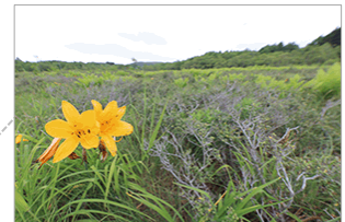
歌才湿原トラスト