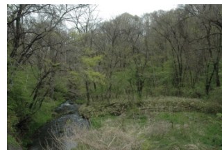
トラスト地のそばを流れる地蔵川の溪流